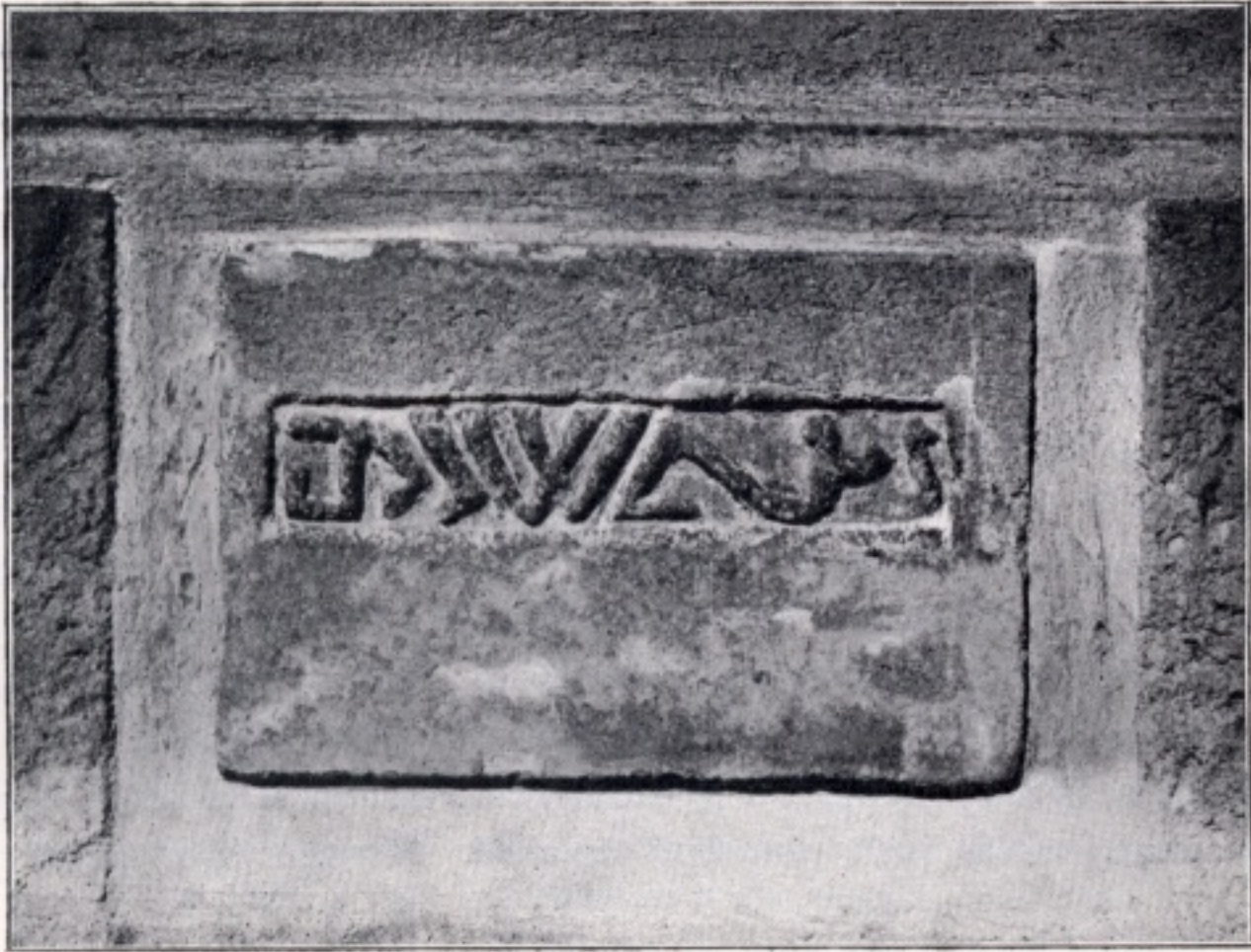
Obr. 243. Třtice. Kámen se záhadným nápisem, zasazený ve zdi kostelní.

ozdobný pás z ornamentu listového. Na plášti pak v lichoběžníku, zdobeném úzkou obrubou — rovnoběžné strany 0·84 m, 1·10 m, výška lichoběžníka 0·40 m — jest nápis o dvanácti řádcích, z nichž pátý a šestý řádek je úplně vysekáním či vypilováním v době pobělohorské odstraněn: Leta Panie 1607 Tento Zwon gest slity przy miestie Rakownice ke cti